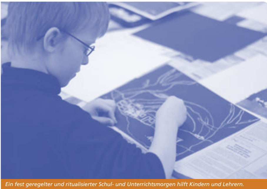
Ein fest geregelter und ritualisierter Schul- und Unterrichtsmorgen hilft Kindern und Lehrern.

Schule ist nicht nur Unterrichtsstätte, sondern auch Lebens- und Erfahrungsraum. Um sich darin orientieren zu können, benötigen Kinder gewisse Normen, an die sie sich halten. Regeln und Rituale sind solche festen verlässlichen Ordnungen in der Lebenswelt der Kinder.