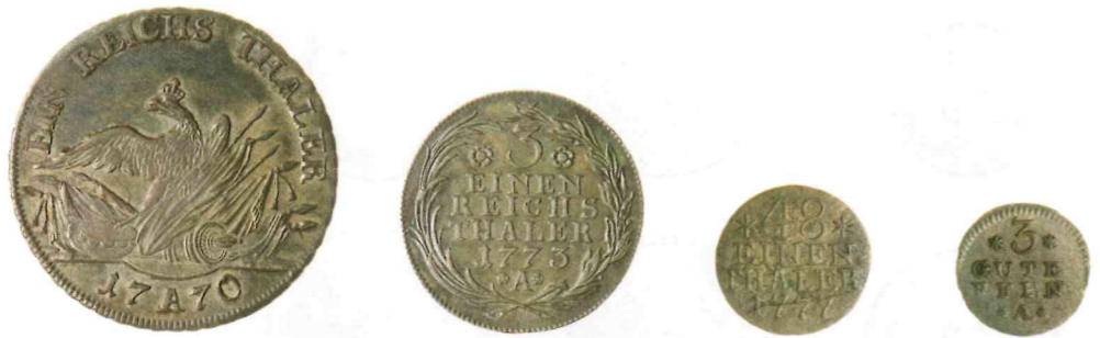
2 Währungen waren keineswegs immer dezimal unterteilt und effizient gestückelt: Um 1770 gab es in Preußen diese Münzen: 1 (Reichs-)Taler (im Bild) – 1/2 T. – 1/3 T. (i. B.) – 1/4 T. – 1/6 T. – 1/12 T. – 1/24 T. – 1/48 Taler (6 Pfennig) (i. B.) – 3 Pf. (i. B.) – 1 Pf.