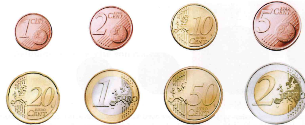
1 Die Größen der Münzen geben keinen verlässlichen Hinweis auf ihren Wert

matisieren dieser Erfahrungen werden die Handlungsmöglichkeiten der Kinder im Alltag enorm erweitert.