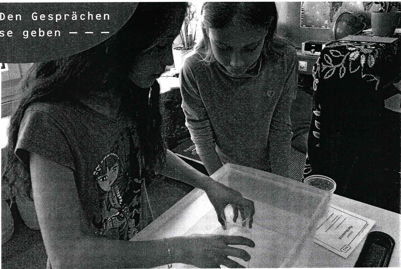
1 | Schülerarbeitsphase: Überprüfen von Vermutungen (Unterrichtsthema „Wie kommt es, dass ein Schiff schwimmt?“)