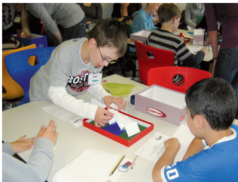
Abb. 2 Wenn es gelingt, bei den Lehrkräften ein stärkeres technisches Interesse zu entwickeln, haben die Kinder bessere Chancen, sich im Unterricht intensiv dem Bauen, Konstruieren oder Experimentieren zu widmen.

Diese Erfahrungen aus Kindergarten und Grundschule werden durch die Ergebnisse der Internationalen Grundschul-Lese-Untersuchung (IGLU 2003) bestätigt: 80 % der befragten Kinder bekundeten ein starkes Interesse, Aufgeschlossenheit und Neugier an naturwissenschaftlichen Fragestellungen.