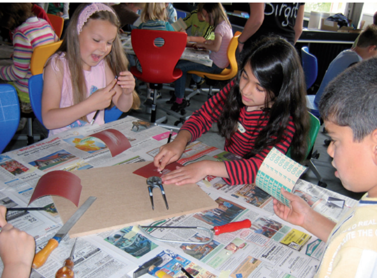
Abb. 3 und Abb. 4 Untersuchung des Bleistifts