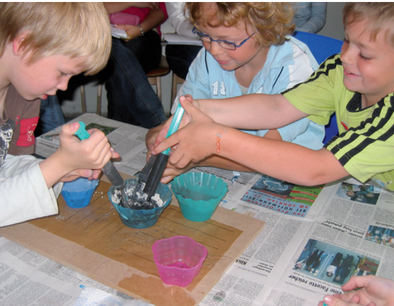
Abb. 5 Herstellung der Masse für die Bleistiftminen

6. Zum Abschluss schauen wir per Film wie Bleistifte industriell gefertigt werden (Bibliothek der Sachgeschichten, DVD B 2: Brücke I-IV und Bleistiftmine*). Die Schülerinnen und Schüler vergleichen anschließend das Gesehene mit ihren eigenen Handlungsschritten und stellen Gemeinsamkeiten und Unterschiede fest. Alternativ wäre auch denkbar, die DVD zu Beginn einzusetzen, die Arbeitsschritte zur Herstellung eines Bleistiftes zu antizipieren und diesen dann herzustellen.