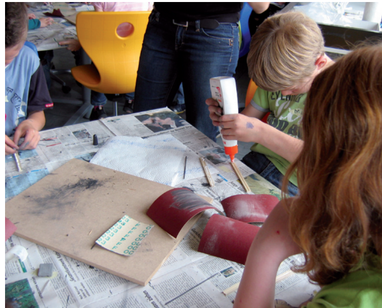
Abb. 6 Herstellung des Bleistiftes