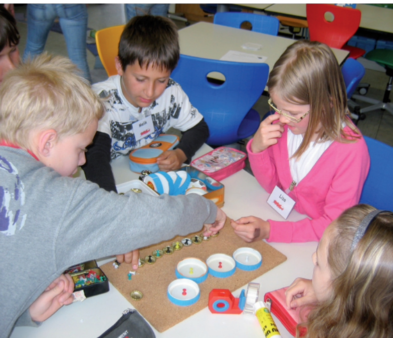
Abb. 1 Nur durch entsprechende Unterrichtsangebote können Mädchen und Jungen Interesse für technische Inhalte entwickeln.

Beste Voraussetzungen für das technische Lernen im Sachunterricht?! Wohl eher nicht, denn der Anteil von Lehrkräften, die ein Studium des naturwissenschaftlichen Lernbereichs des Sachunterrichts absolvieren, ist gering (vgl. Landwehr 2002). Da in Deutschland in der Grundschule in der Mehrheit Frauen unterrichten, könnte man annehmen, dass eine Vernachlässigung dieses Themengebiets durch den Überhang an Lehrerinnen begründet sein kann. Gestützt wird diese Vermutung durch Untersuchungen, die belegen, dass Lehrerinnen ein sichtlich geringeres Interesse an technischen und naturwissenschaftlichen Themen haben als ihre männlichen Kollegen. So stellt Dengler (1995, 62) fest, dass Frauen Physik „deutlich anstrengender, weniger interessant, weniger begeisternd, weniger positiv, weniger wichtig und weniger nützlich“ finden als Männer. Möller u. a. weisen auf den Zusammenhang hin, dass die Interessen der Lehrerinnen im Technikbereich weit geringer ausgeprägt sind als die der Lehrer (vgl. Möller u. a. 1996, 26;