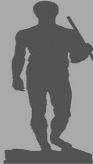
Polyklets Doryphoros von 440 v. Chr.