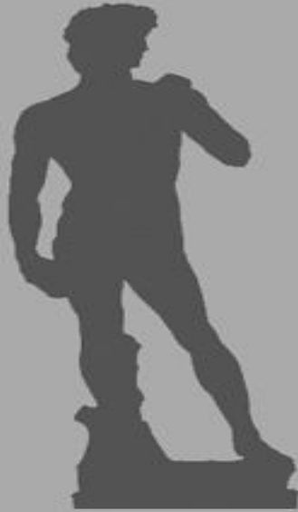
Michelangelos David 1504 n. Chr.