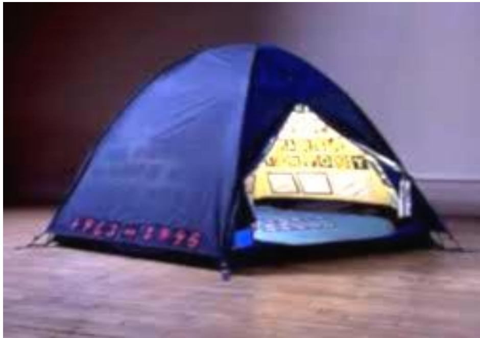
Tracey Emin "Everyone I Have Ever Slept With" 1963-1995"

„ Die Installation mag aus keinem Objekt bestehen, ist jedoch eine räumliche Erfahrung, nicht ungleich einer architektonischen Manifestation.“