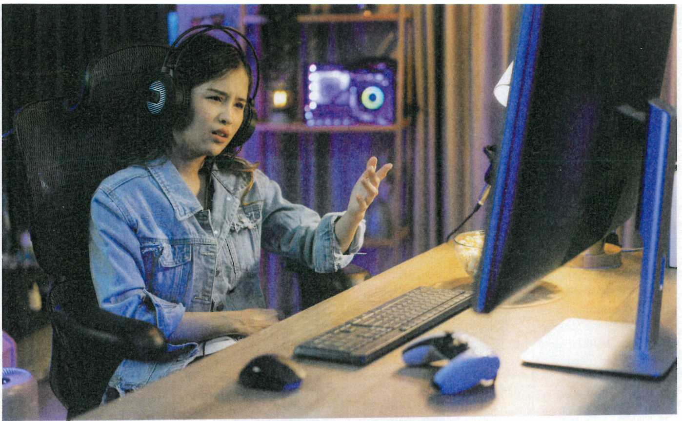
Im Verlauf von Computerspielen kommt es oft wie selbstverständlich zu beleidigenden und verletzenden Äußerungen, dafür kann der Deutschunterricht sensibilisieren